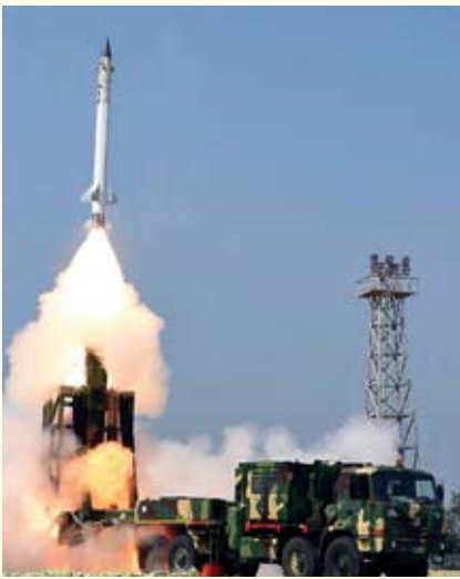
ए ए डी एन्डो-ऐटमोस्फेरिक इंटरसेप्टर मिसाइल