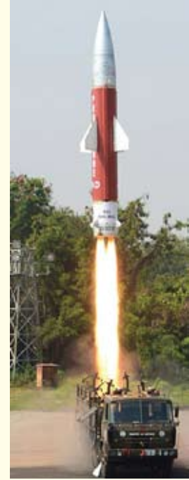
ए ए डी लक्ष्य मिसाइल