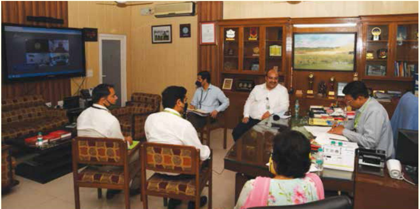
निदेशक, टीबीआरएल, टीबीआरएल में समझौता ज्ञापन दस्तावेज पर हस्ताक्षर करते हुए निदेशक एचएसएफसी ने वीडियो वार्तायोजन के माध्यम से समारोह में भाग लिया।

एवं निदेशक, टीबीआरएल, ने भारत के पहले मानव अंतरिक्ष मिशन के लिए टीबीआरएल द्वारा आवश्यक वैज्ञानिक सहायता प्रदान करने के लिए पूर्ण प्रतिबद्धता का वचन दिया। टीबीआरएल में दो चरणीय प्रकाश गैस गन सुविधा, जो कि 5000 m/s से अधिक की गति प्राप्त करने के लिए भारत में एकमात्र जांच सुविधा है का उपयोग द्रुतगति प्रभाव अध्ययन आयोजित करने के लिए किया जाएगा। मानव अंतरिक्ष मिशन की कड़ी समयसीमाओं को पूरा करने के लिए आंतरिक प्राक्षेपिक मानकों और उच्च गति निदान स्थापित करने के लिए नकली लक्ष्यों पर कुछ संभाव्यता परीक्षण पहले ही आयोजित किए जा चुके हैं।