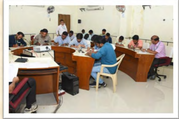
हिंदी दिवस एवं हिंदी पखवाड़ा समारोह 2025