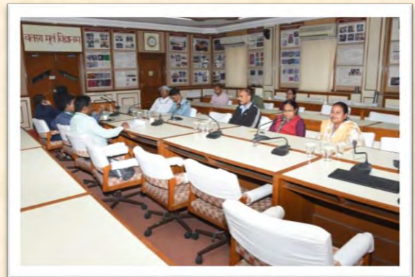
विश्व हिंदी दिवस समारोह