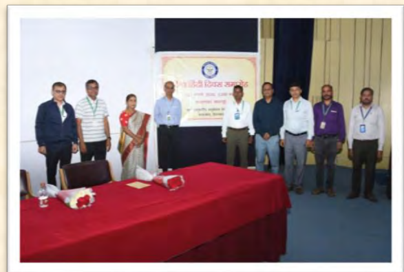
विश्व हिंदी दिवस समारोह