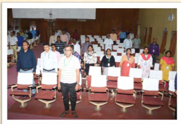
विश्व हिंदी दिवस समारोह