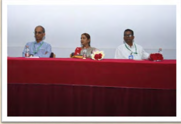
विश्व हिंदी दिवस समारोह