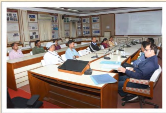
विश्व हिंदी दिवस समारोह