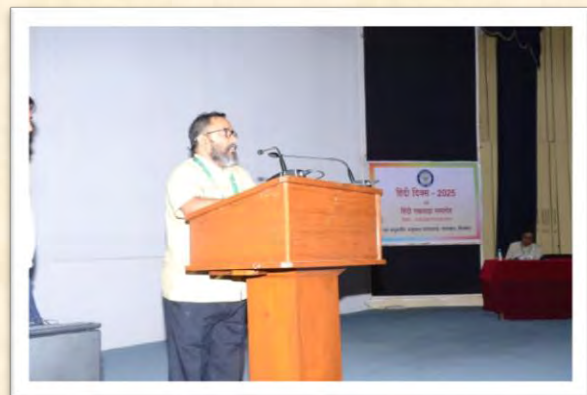
हिंदी दिवस एवं हिंदी पखवाड़ा समारोह 2025