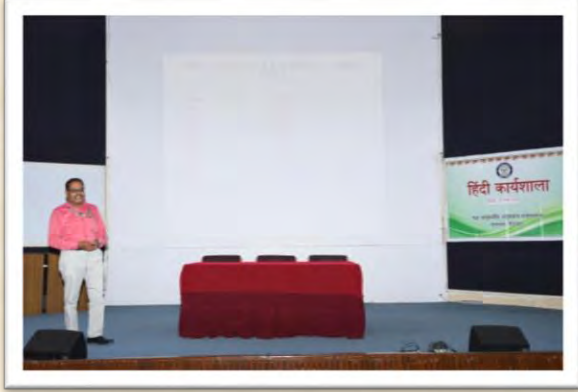
हिंदी कार्यशाला (14 अगस्त 2025)