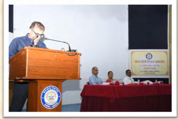
विश्व हिंदी दिवस समारोह