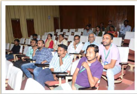
हिंदी दिवस एवं हिंदी पखवाड़ा समारोह 2025