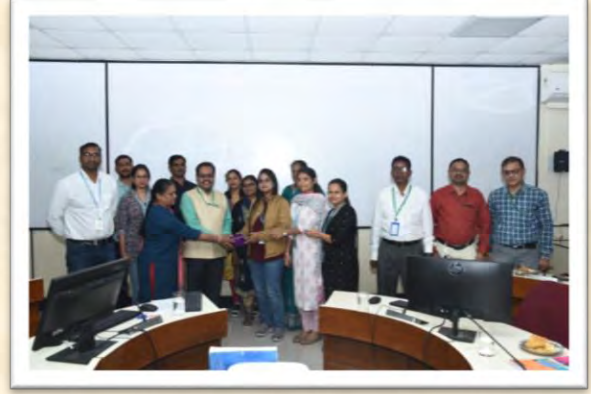
हिंदी आशुलिपि गहन प्रशिक्षण कार्यक्रम