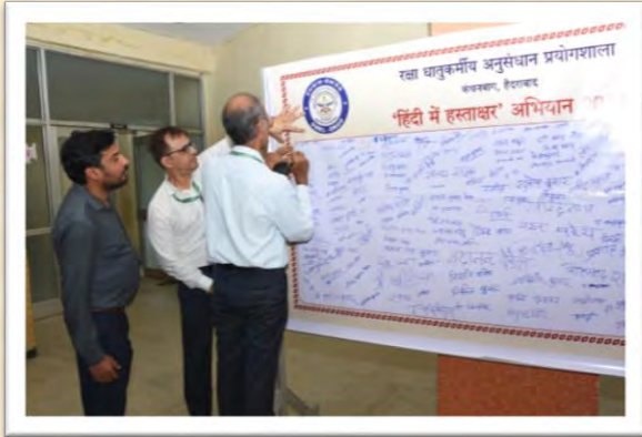
'हिंदी में हस्ताक्षर' अभियान 2025