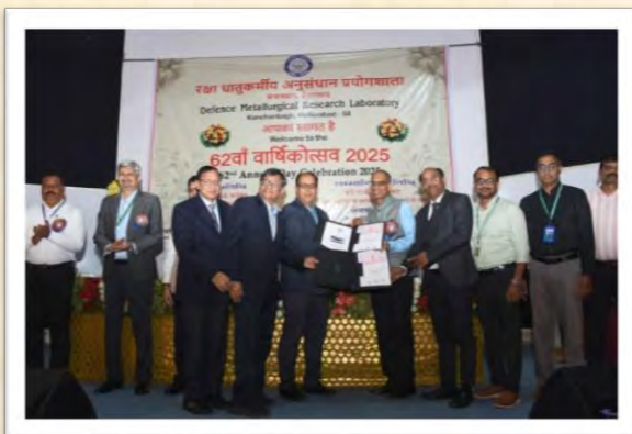
62वां वार्षिकोत्सव 2025