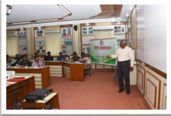
हिंदी कार्यशाला (13 जून 2025)