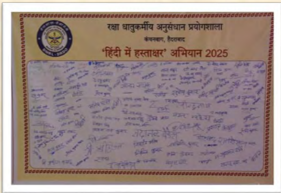
'हिंदी में हस्ताक्षर' अभियान 2025