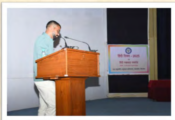
हिंदी दिवस एवं हिंदी पखवाड़ा समारोह 2025