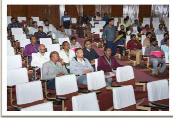
आंतरिक चर्चा-परिचर्चा बैठक (27.11.2025)