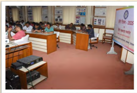
हिंदी दिवस एवं हिंदी पखवाड़ा समारोह 2025