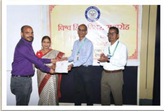
विश्व हिंदी दिवस समारोह