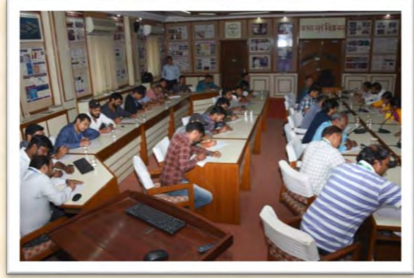
हिंदी दिवस एवं हिंदी पखवाड़ा समारोह 2025