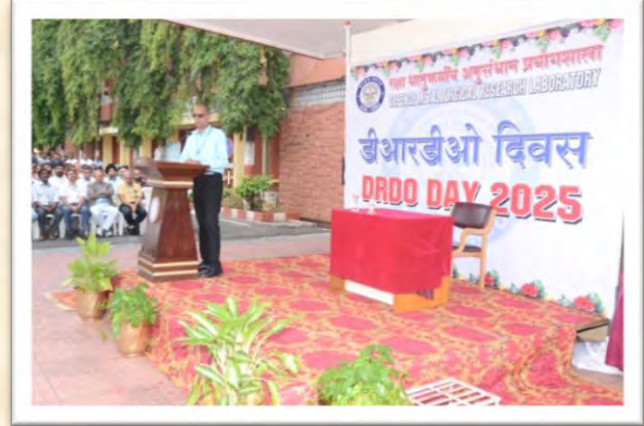
डीआरडीओ दिवस 2025