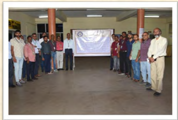
'हिंदी में हस्ताक्षर' अभियान 2025