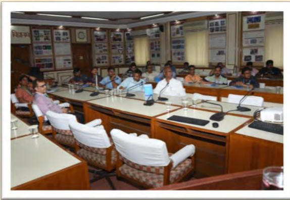
हिंदी कार्यशाला (13 जून 2025)