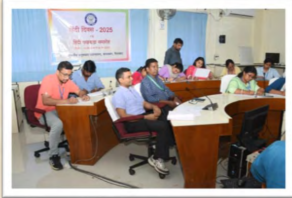
हिंदी दिवस एवं हिंदी पखवाड़ा समारोह 2025