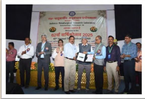
62वां वार्षिकोत्सव 2025