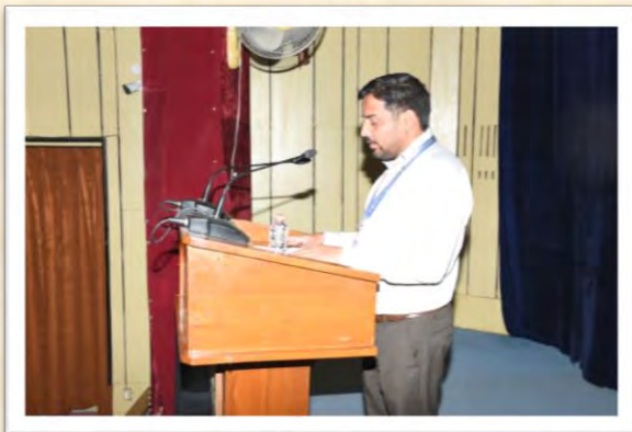
विश्व हिंदी दिवस समारोह