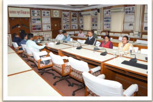
विश्व हिंदी दिवस समारोह