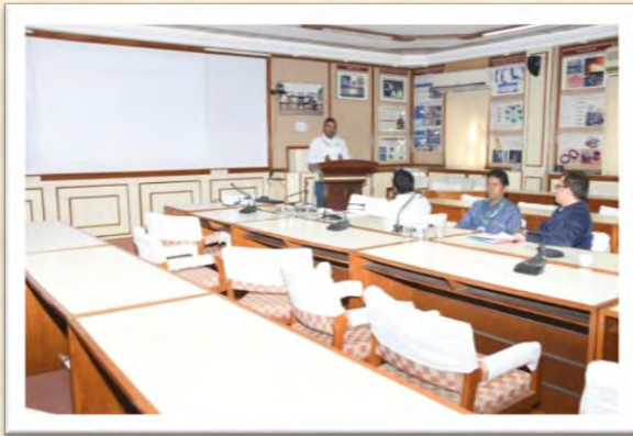
विश्व हिंदी दिवस समारोह