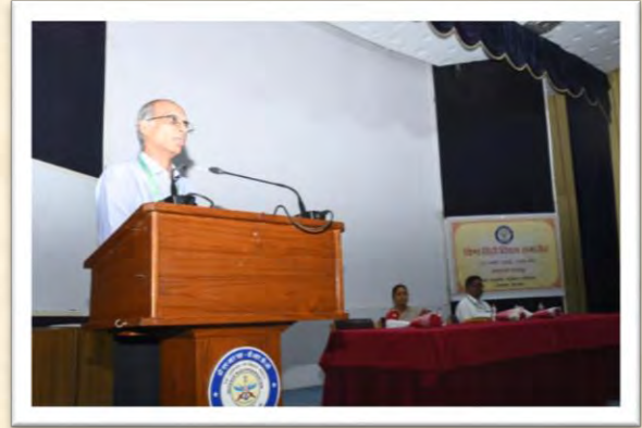
विश्व हिंदी दिवस समारोह