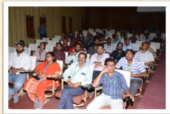
हिंदी दिवस एवं हिंदी पखवाड़ा समारोह 2025