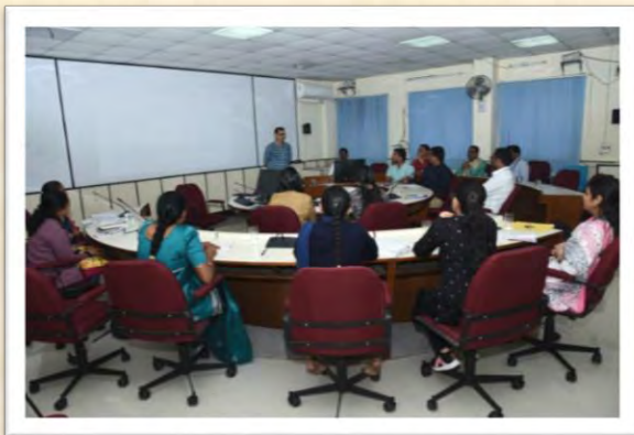
हिंदी आशुलिपि गहन प्रशिक्षण कार्यक्रम