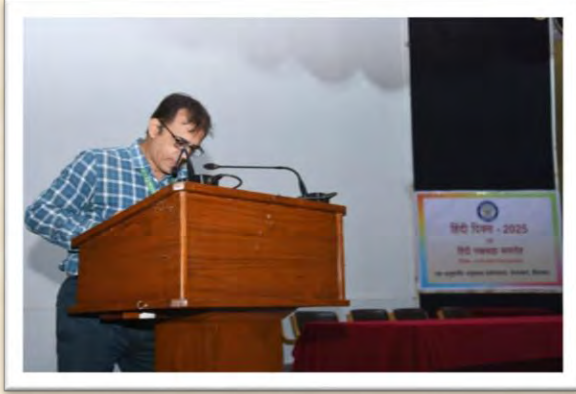
हिंदी दिवस एवं हिंदी पखवाड़ा समारोह 2025