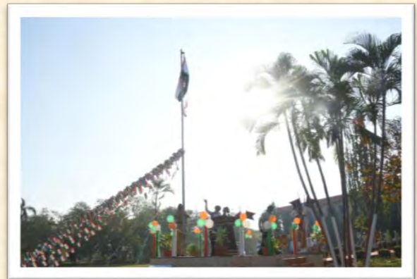
गणतंत्र दिवस 2025