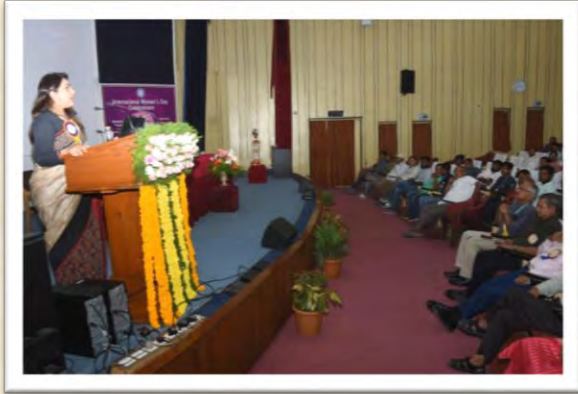
अंतरराष्ट्रीय महिला दिवस 2025