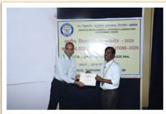
राष्ट्रीय विज्ञान दिवस 2025