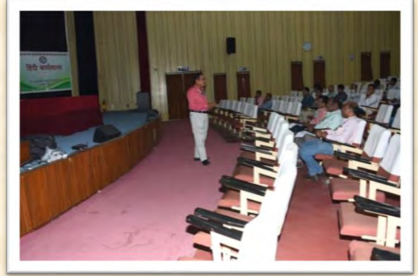
हिंदी कार्यशाला (14 अगस्त 2025)