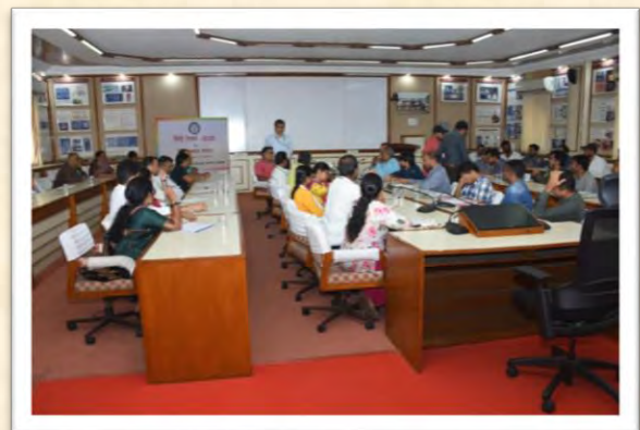
हिंदी दिवस एवं हिंदी पखवाड़ा समारोह 2025