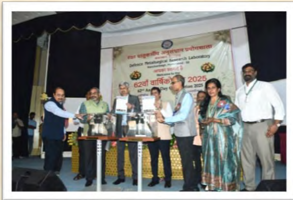
62वां वार्षिकोत्सव 2025