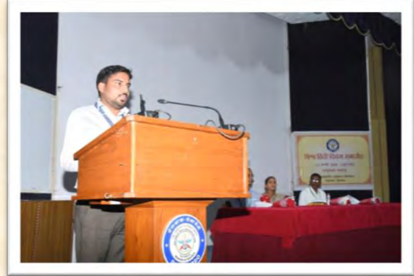
विश्व हिंदी दिवस समारोह