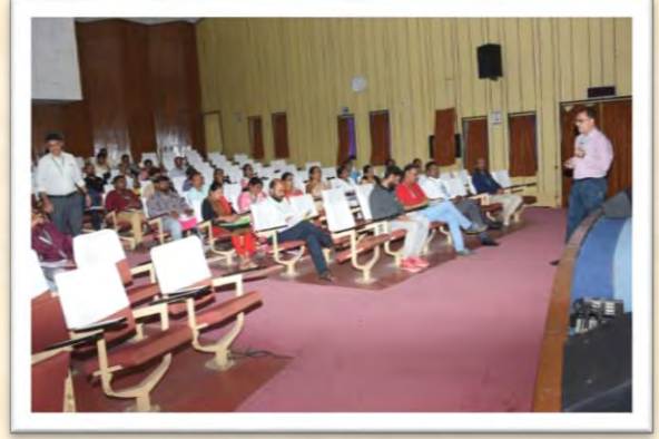
आंतरिक चर्चा-परिचर्चा बैठक (27.11.2025)