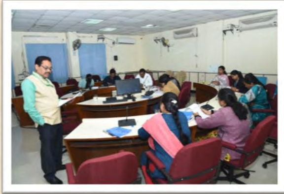
हिंदी आशुलिपि गहन प्रशिक्षण कार्यक्रम