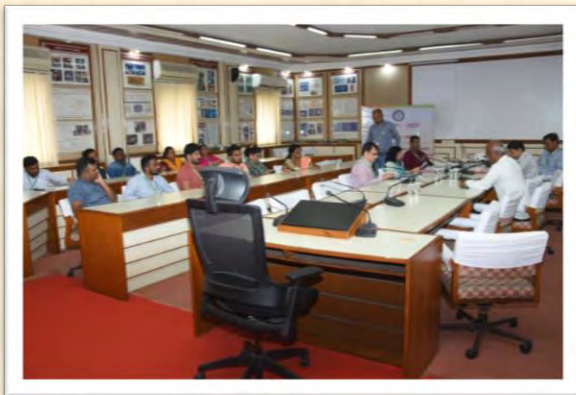
हिंदी दिवस एवं हिंदी पखवाड़ा समारोह 2025