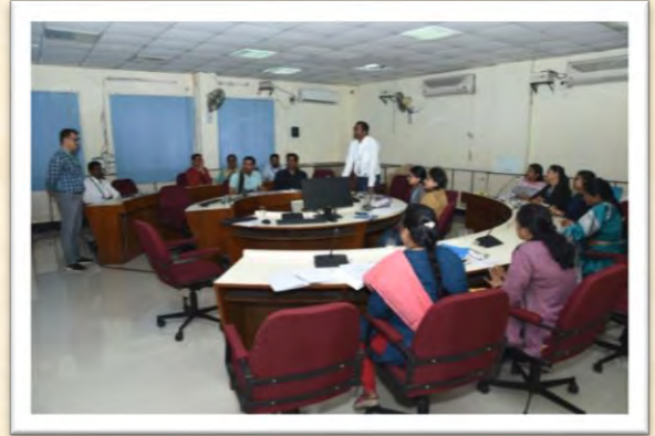
हिंदी आशुलिपि गहन प्रशिक्षण कार्यक्रम