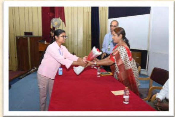
विश्व हिंदी दिवस समारोह