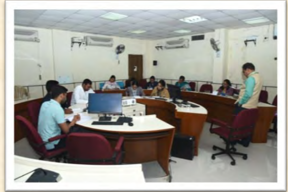
हिंदी आशुलिपि गहन प्रशिक्षण कार्यक्रम