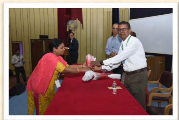
विश्व हिंदी दिवस समारोह