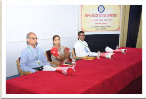
विश्व हिंदी दिवस समारोह