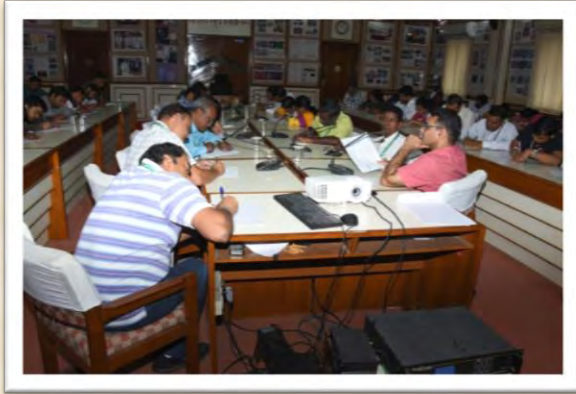
हिंदी दिवस एवं हिंदी पखवाड़ा समारोह 2025