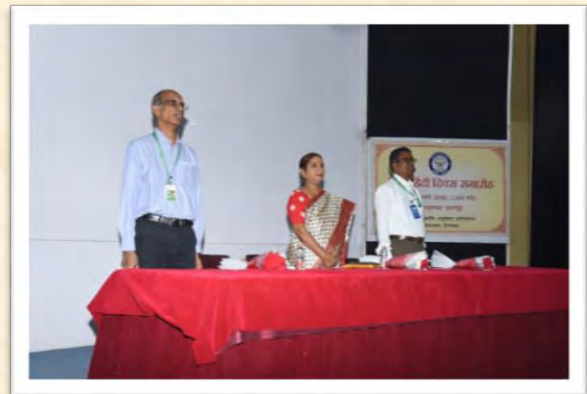
विश्व हिंदी दिवस समारोह