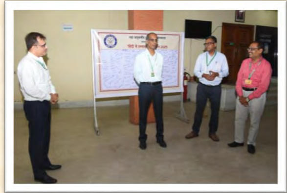
'हिंदी में हस्ताक्षर' अभियान 2025