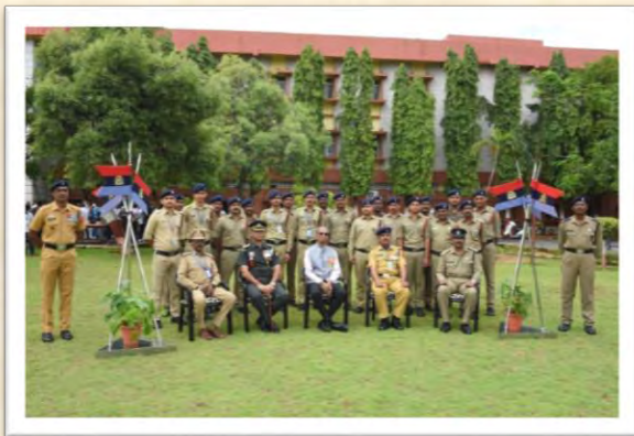
स्वतंत्रता दिवस 2025