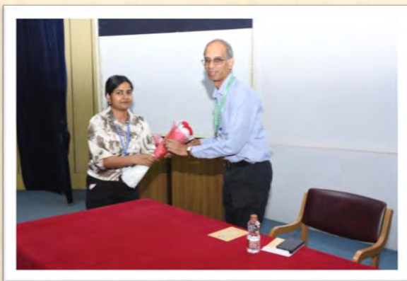
विश्व हिंदी दिवस समारोह