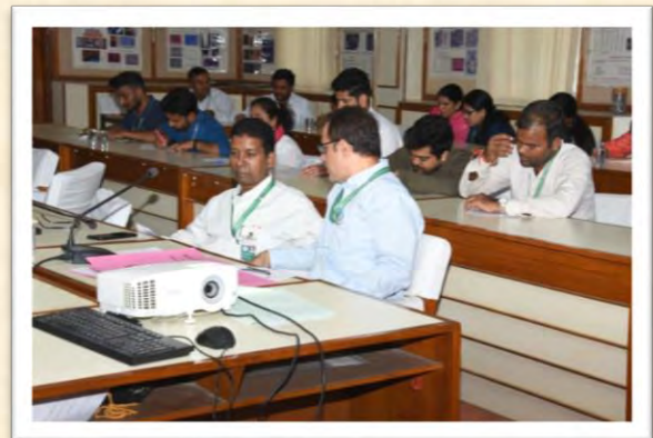
हिंदी दिवस एवं हिंदी पखवाड़ा समारोह 2025