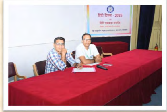
हिंदी दिवस एवं हिंदी पखवाड़ा समारोह 2025