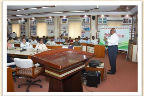
हिंदी कार्यशाला (17 दिसंबर 2025)