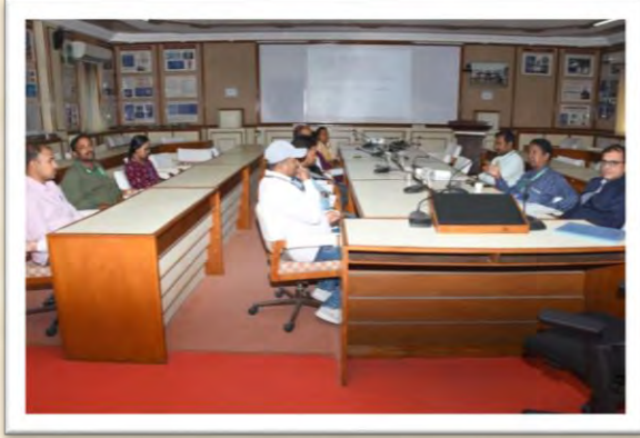
विश्व हिंदी दिवस समारोह