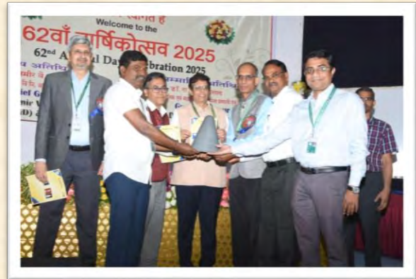
62वां वार्षिकोत्सव 2025