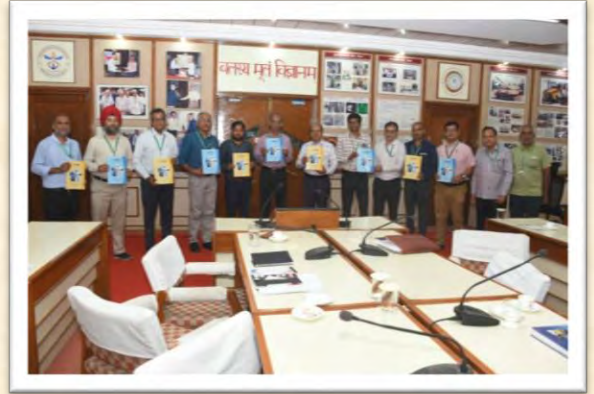
'रचना' अंक-18 का विमोचन