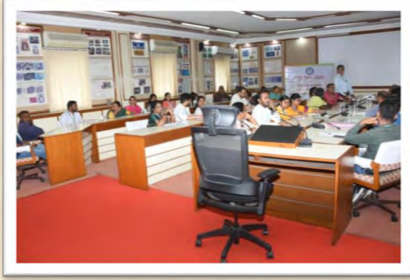
हिंदी दिवस एवं हिंदी पखवाड़ा समारोह 2025