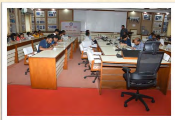
हिंदी दिवस एवं हिंदी पखवाड़ा समारोह 2025