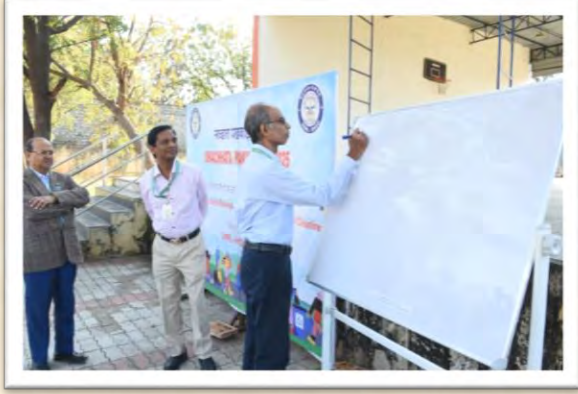
स्वच्छता पखवाड़ा 2025