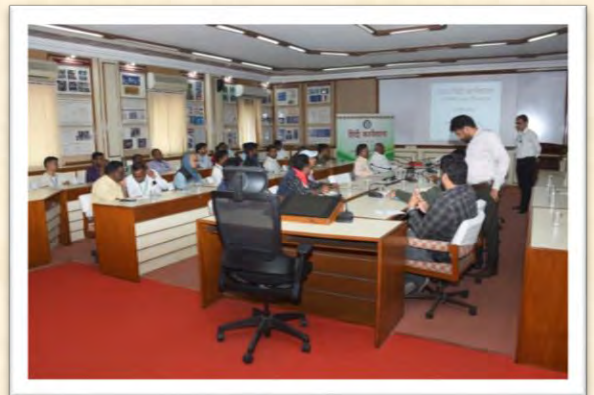
हिंदी कार्यशाला (17 दिसंबर 2025)