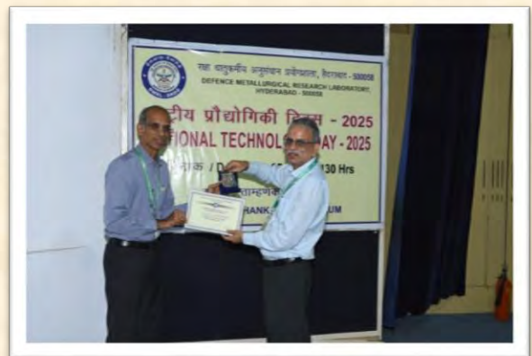
राष्ट्रीय प्रौद्योगिकी दिवस 2025