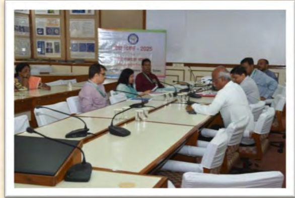
हिंदी दिवस एवं हिंदी पखवाड़ा समारोह 2025