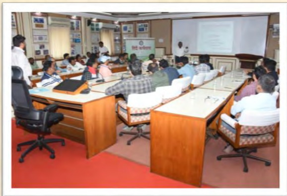
हिंदी कार्यशाला (17 दिसंबर 2025)