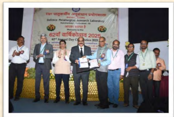
62वां वार्षिकोत्सव 2025