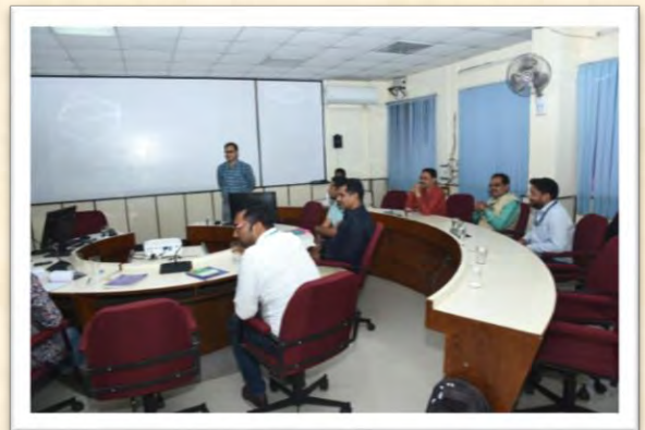
हिंदी आशुलिपि गहन प्रशिक्षण कार्यक्रम