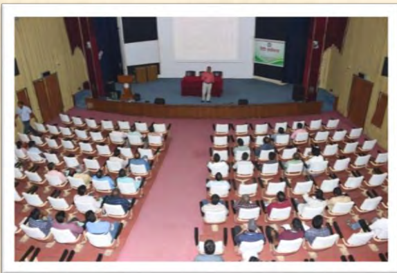
हिंदी कार्यशाला (14 अगस्त 2025)