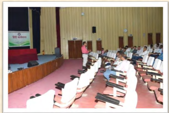
हिंदी कार्यशाला (14 अगस्त 2025)