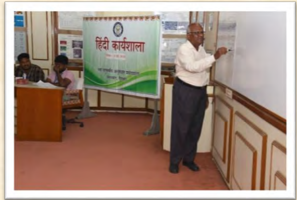
हिंदी कार्यशाला (13 जून 2025)