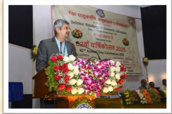
62वां वार्षिकोत्सव 2025