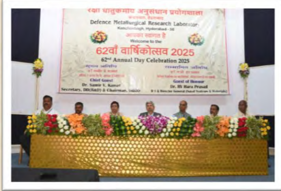
62वां वार्षिकोत्सव 2025