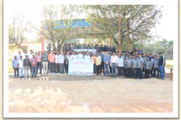
स्वच्छता पखवाड़ा 2025