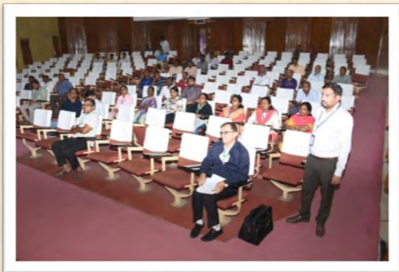
विश्व हिंदी दिवस समारोह