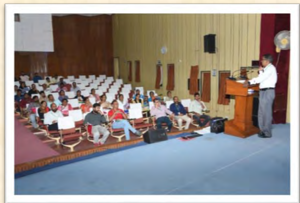
आंतरिक चर्चा-परिचर्चा बैठक (27.11.2025)