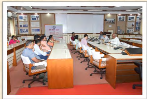
हिंदी दिवस एवं हिंदी पखवाड़ा समारोह 2025