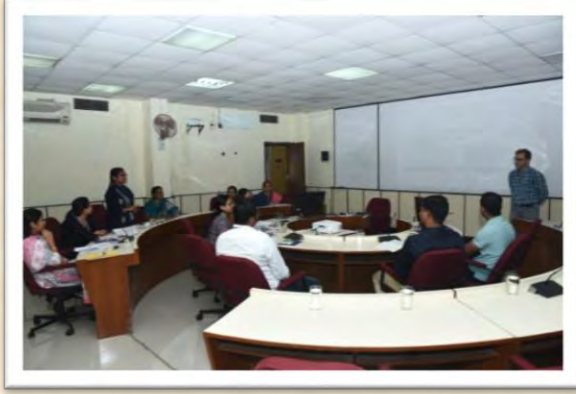
हिंदी आशुलिपि गहन प्रशिक्षण कार्यक्रम