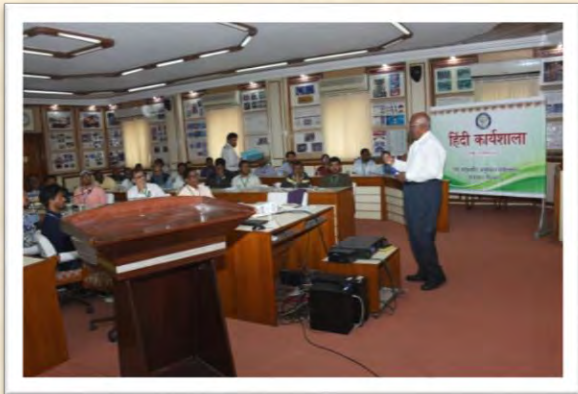
हिंदी कार्यशाला (17 दिसंबर 2025)