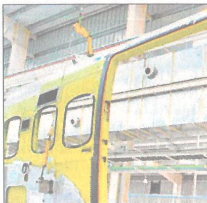
The construction will finish by the end of 2026.

The C-130J MRO facility will provide depot-level and heavy maintenance; component