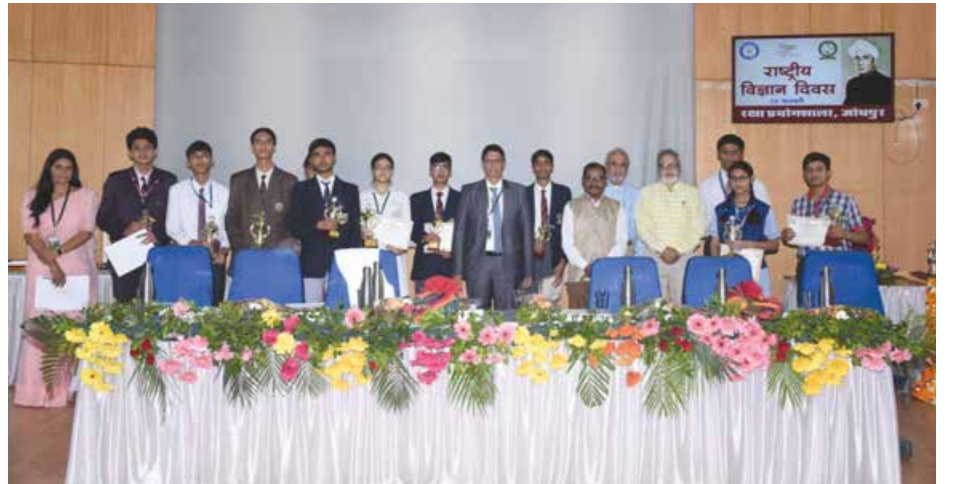
डीएल, जोधपुर में राष्ट्रीय विज्ञान दिवस समारोह