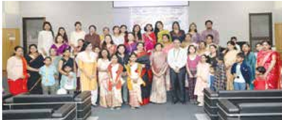
डीआरएल, तेजपुर में अंतर्राष्ट्रीय महिला दिवस 2023 समारोह

अंतर्राष्ट्रीय महिला दिवस-2023 के भाग के रूप में, रक्षा अनुसंधान प्रयोगशाला (डीआरएल), तेजपुर के महिला प्रकोष्ठ ने 14 मार्च 2023 को एक कार्यशाला 'विज्ञान