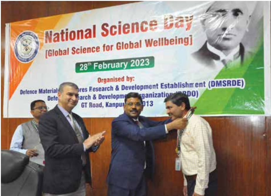
डीएमएसआरडीई, कानपुर में राष्ट्रीय विज्ञान दिवस समारोह